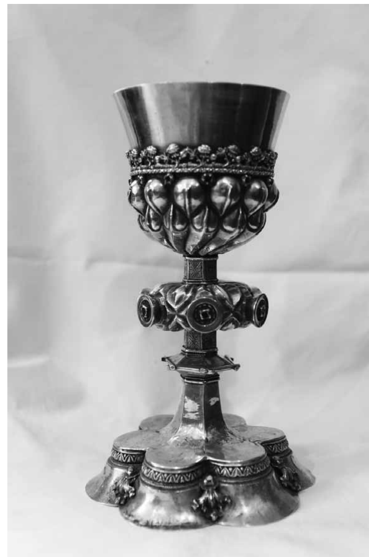
2. kép Gótikus kehely (Brassó)