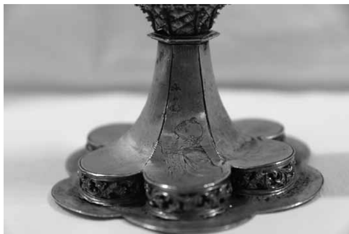
1c. kép Kehely talprészlet (Csernátfalu)