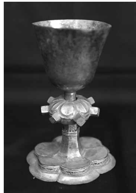
3. kép Gótikus kehely (Pürkerec)