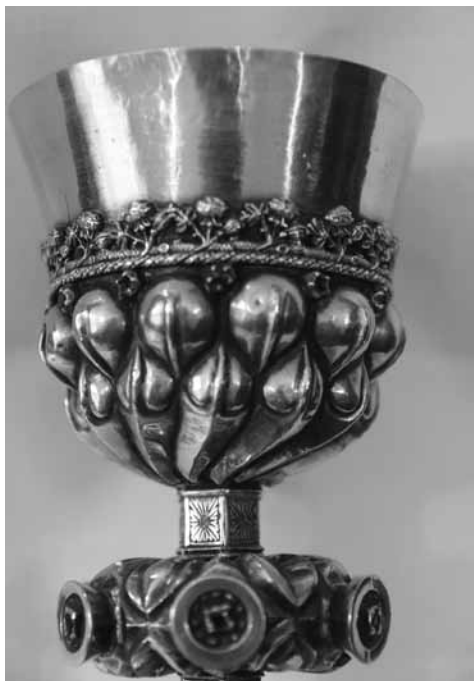
2b. kép Kehely hólyagsoros kuppája (Brassó)