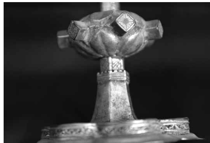
3a. kép Kehely részlet (Pürkerec)