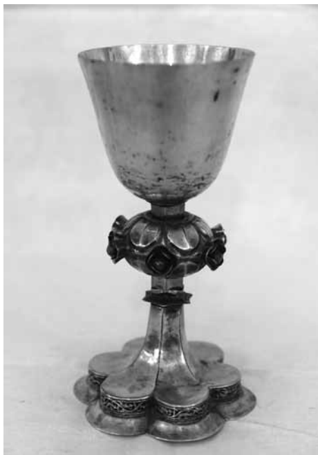
4. kép Gótikus kébely (Tatrang)