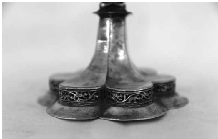
4a. kép Kébely talpa (Tatrang)