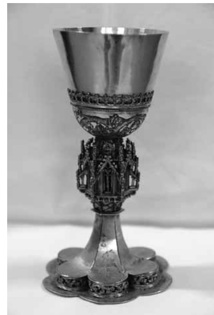
1. kép Gótikus kehely (Csernátfalu)

1983 Zlasnitsvo na Slovensku. Bratislava