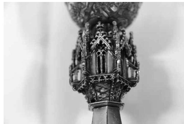
1a. kép Kehely nádusza (Csernátfalu)