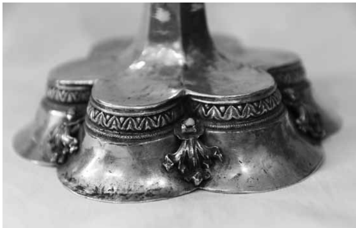
2a. kép Kehely talpa (Brassó)