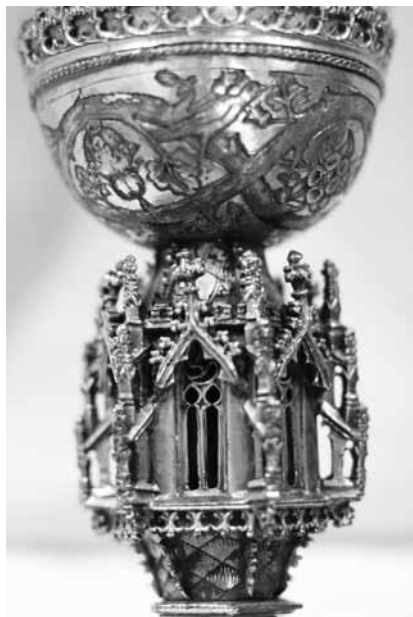
1b. kép Kehely kuppakosarának részlete (Csernátfalu)